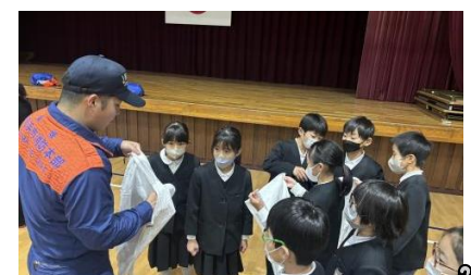
12/18 少年消防クラブ（3年）